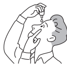
容器の先が目、まぶた、まつ毛にふれないように